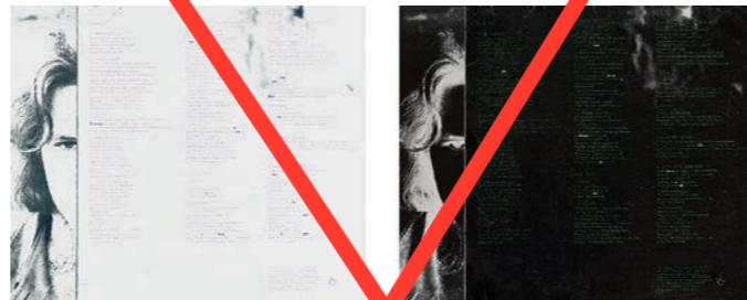
2017, 2 Archival Pigment Prints, je: 29 x 29,6 cm, gesamt: 29 x 71,2 cm, ungerahmt Auflage 15 + 3 AP, davon Nr. 1-4 für den Heidelberger Kunstverein