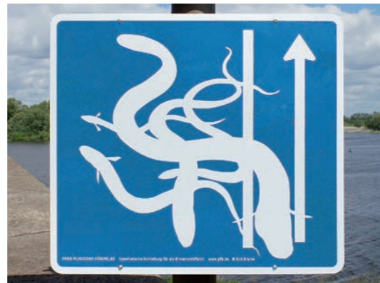
2014/2017, Aluminiumschild, 2mm stark, 60 x 67,2 cm (produziert in Zusammenarbeit mit der GFLK – Galerie für Landschaftskunst)

Bob Braines ›Straßenschild‹ zeigt Verkehrsrichtungspfeile, die von stilisierten Aalen gekreuzt werden. Grundlage war eine Zeichnung aus dem Jahr 2014, die im Rahmen des Projekts ›Die Freie Flusszone Süderelbe‹ entstand. Im Heidelberger Kunstverein war es in Größe eines Autobahnschildes zu sehen. Die Jahresgabe zeigt das gleiche Motiv in handlicher Größe versehen mit Befestigungsmitteln zur Anbringung im Außenraum.