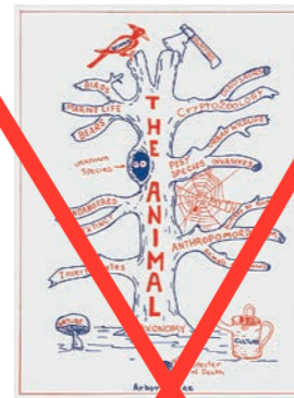
2016, Siebdruck auf Papier, 30 x 22,7 cm, Nr. 21 von 30

Das mit blauweißen Fliesen verkleidete lebensgroße Modell von Mark Dions ›Hexagon der Flussbarriere‹ bildete das Eingangstor zur Ausstellung ›Die Idee der freien Flusszone‹. Mark Dion befasste sich seit Mitte der 1980er Jahre intensiv mit dem Umgang mit Natur und untersucht speziell die Repräsentationen der Natur in den Wissenschaften als Symptome politischer, gesellschaftlicher und kultureller Diskurse.