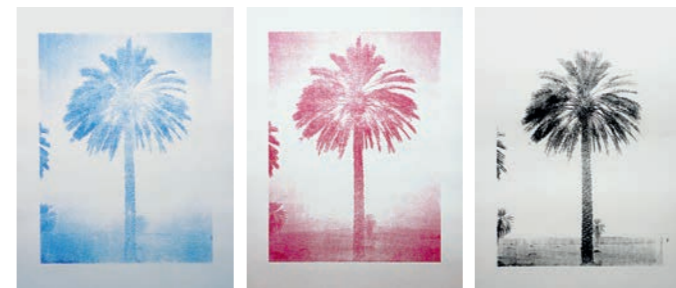
2017, 3 Siebdrucke (C, M, K) auf säurefreiem Karton, 70 x 52 cm, Auflage: je 10

Den handgefertigten Siebdrucken liegen gefundene Aufnahmen von Palmen im Irak zugrunde. Die Palme hat im Irak eine identi- tätsstiftende Bedeutung. Nachdem die alliierten Truppen viele Palmen-Plantagen abholzen ließen, wurde sie zum Symbol für die Verletzungen, die der Irak durch die militärische Besatzung erlitten hat. Dem steht unser westlich geprägtes Bild der Palme als romantisches Südsee-Motiv gegenüber.