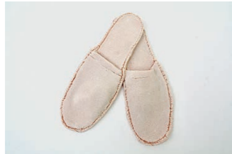
2017, Stärke, Natrium, Salz, Rote Beete, 11.2 x 31.5 cm / 10.6 x 28.75 cm Edition: 100 Paare. Die Slipper kommen in Paaren in einer Box.

Für den Kunstverein Heidelberg habe ich als Jahresgabe eine Serie von Objekten angefertigt, die an Hausschuhe aus Hotels, Spas und Flugzeugen erinnern. Es geht um das Reisen und um Souvenirs. Um Geschwindigkeit und Komfort. Gleichzeitig um standardisierte Formen industrieller Produktion und das Ver- trauen in Objekte, die zum Wegwerfen entworfen sind. Bei den Materialien Stärke, Natrium, Salz und natürlichen Farbstoffen handelt es sich um Nahrungsmittel. Auch sie erzählen von Kon- sum, industrieller Verarbeitung und Verbreitung, letztlich die Gebrauchsgeschichte der Objekte. (E. Erkan)